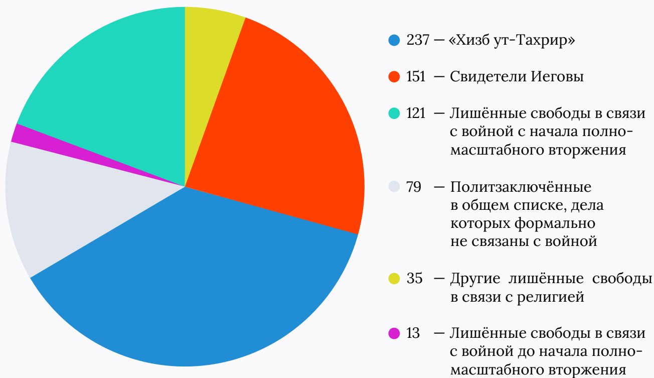
График 2. Состав списков политзаключённых

Несмотря на то что в годы войны темпы роста «общего» списка гораздо выше, чем «религиозного», лишённые свободы по обвинениям в причастности к «Хизб ут-Тахрир» и Свидетелям Иеговы всё ещё составляют самые крупные группы политзаключённых.